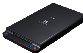
DIN A4-Flachbett-Scaneinheit 102

Scannen Sie Bücher, Zeitschriften und empfindliche Medien mit der optionalen Flachbett-Scaneinheit 102 (bis DIN A4) oder der Flachbett-Scaneinheit 201 (bis DIN A3). Einfach per USB angeschlossen, arbeiten diese Flachbettscanner nahtlos mit dem DR-C225 II (ausschließlich) zusammen und ermöglichen die Anwendung aller verfügbaren Funktionen zur Bildverbesserung.